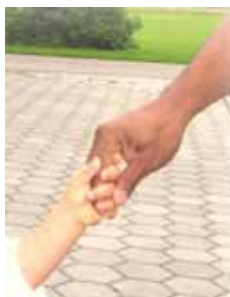
Das Wohl des Kindes steht zur Reform des Sorgerechts im Mittelpunkt.

Eine absolute Gleichstellung bedeutet die Reform nicht. Denn die Mutter hat die Möglichkeit, Widerspruch gegen das gemeinsame Sorgerecht einzulegen. Bisher konnte der ledige Vater den Antrag auf das gemeinsame Sorgerecht