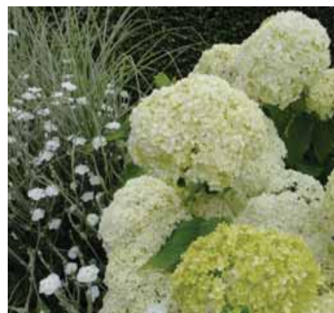
Das Zusammenspiel von verschiedenen Blütenformen und Farbnuancen macht den weißen Garten interessant. Foto: BGL.

Seine phänomenale Wirkung entfaltet der weiße Garten abends - ein klarer Vorteil für Berufstätige, die tagsüber nicht zuhause sind. Weiß bietet von allen Farben die größtmögliche Helligkeit, es reflektiert das Licht am besten. Dies führt dazu, dass Pflanzen mit hellen Blüten - auch wenn es dämmt leuchtend strahlen. BGL