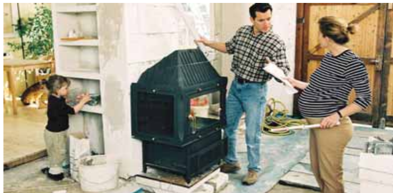
Ein Umbau schafft Platz für neue Familienmitglieder und auch neue Lebenssituationen.

trifft auch dann zu, wenn mehrere Generationen unter einem Dach wohnen wollen, aber auch ihren eigenen Freiraum schätzen. Eine Aufstockung des Dachs oder ein Anbau im Garten kann in diesen Fällen die nötigen Raumreserven schaffen.