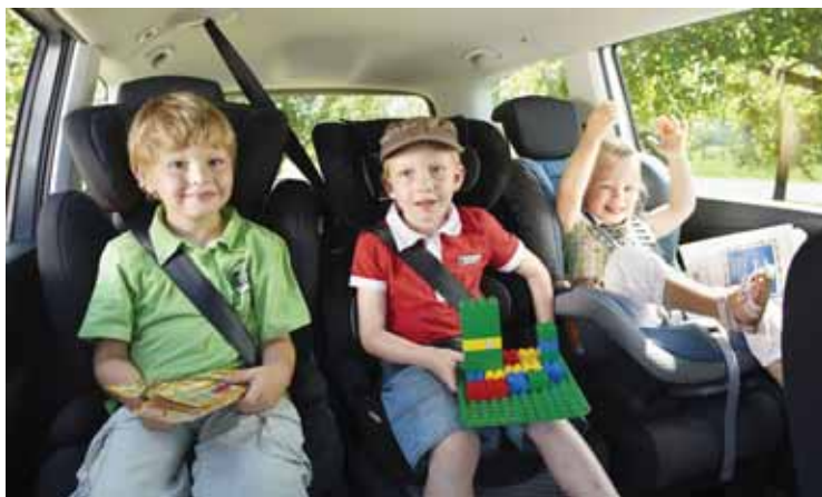
Nur wer sicher sitzt, kommt sicher ans Ziel. Daher ist die Wahl des passenden Kindersitzes wichtig.

Dazu gehört natürlich auch dafür zu sorgen, dass das eigene Fahrzeug verkehrssicher ist, um so Gefahren für sich selbst und die anderen Verkehrsteilnehmer zu vermeiden. Ganz wichtig ist, dass die Kleinen im Auto sicher sitzen. Denn sie sind den größten Gefahren ausgesetzt. In Deutschland ist es gesetzlich vorgeschrieben, dass jedes Kind einen speziellen Sitz benutzt, solange es jünger als 12 Jahre oder kleiner als 1,50 Meter ist. Da bei Neugeborenen die