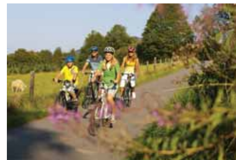
Wandern und Radeln liegen im Trend: Schöne Ziele sind nicht fern.

Fahrvergnügen für Familien und Tourenradler: Das ist der SauerlandRadring. Auf jedem Kilometer gibt es Neues zu entdecken. Anstiege halten sich in Grenzen, weil die Strecke einer Bahntrasse folgt: Radspaß für die ganze Familie. Der Rothaarsteig liegt in einer der schönsten Waldgebirgslandschaften Deutschlands. Gier kommen die Wanderer zu ihrem Vergnügen. Aber auch die Lippe